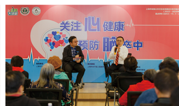
“关注心健康 预防脑卒中” 大讲堂现场照片