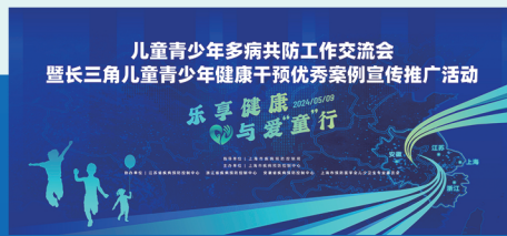
儿童青少年多病共防工作交流会暨长三角儿童青少年健康干预优秀案例宣传推广活动