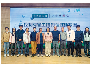
“控制有害生物 打造健康校园” 世界害虫日宣传活动