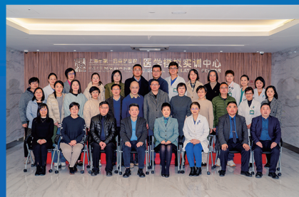
上海市预防医学会出生缺陷防控专业委员会成立