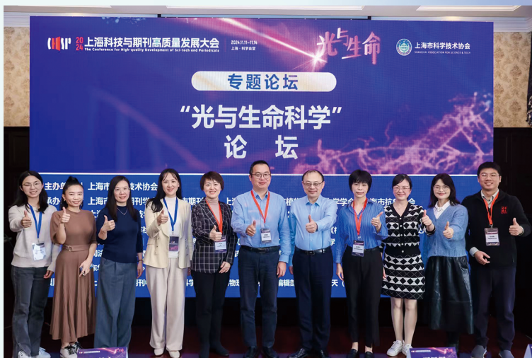
《上海预防医学》杂志与上海市科协、上海市科技期刊学会等单位 共同举办 2024 上海科技与期刊高质量大会 (现场合照)