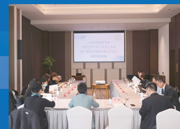
党的工作小组（扩大）会议、七届三次常务理事会议