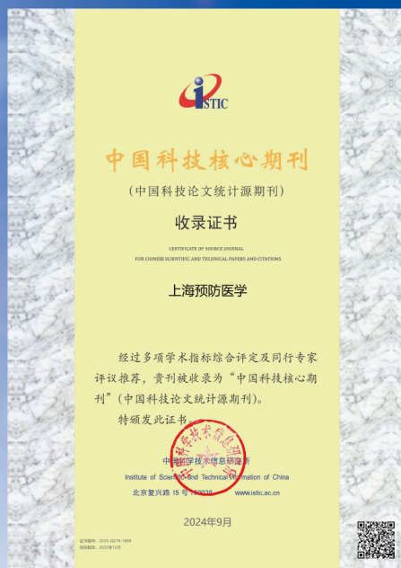
2024 年《上海预防医学》中国科技核心期刊收录证书