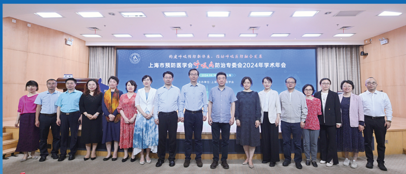
上海市预防医学会呼吸病防治专委会 2024 年学术年会合照