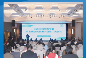
七届二次会员代表大会