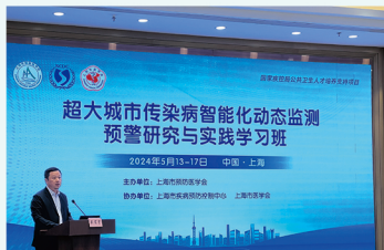
超大城市传染病智能化 动态监测预警研究与实践学习班