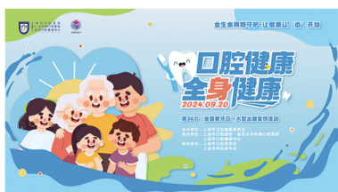
“口腔健康 全身健康”第 36 个 “全国爱牙日”大型主题宣传活动