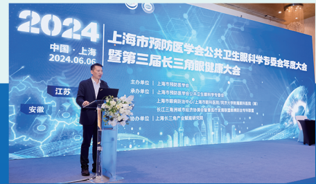
上海市预防医学会公共卫生眼科学专委会年度大会暨第三届长三角眼健康大会