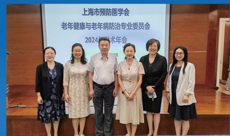
上海市预防医学会老年健康与老年病防治专业委员会 2024 年学术年会