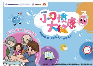
“小习惯大健康”系列科普 ——洗手知识大闯关