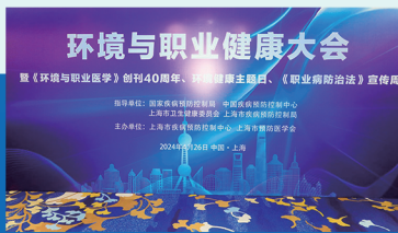
环境与职业健康大会

苏浙皖“三省一市”的传染病防控、病原检验专业人员 250 余人参加了本次论坛。本次学术论坛得到了上海市科学技术协会的大力指导和支持。