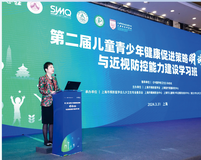
第二届儿童青少年健康促进策略 与近视防控能力建设学习班