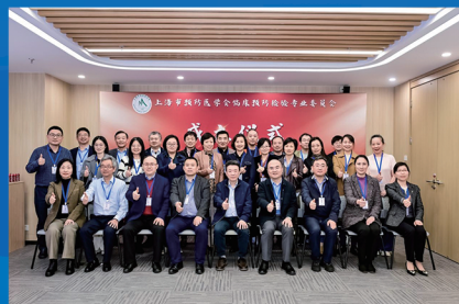
上海市预防医学会临床预防检验专业委员会成立