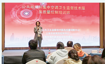
公共场所和集中空调卫生监督技术服务 质量控制培训班