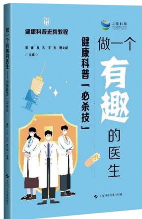
科普图书《做一个有趣的医生 ——健康科普“必杀技”》