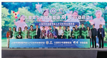
儿童青少年健康促进“明珠”行动启动