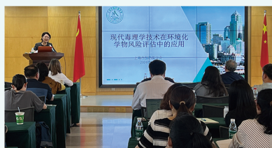
现代毒理学技术在环境化学物风险评估中的应用