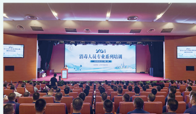
消毒培训进消防 共同守护城市公共安全 ——2024 年消毒人员专业系列培训